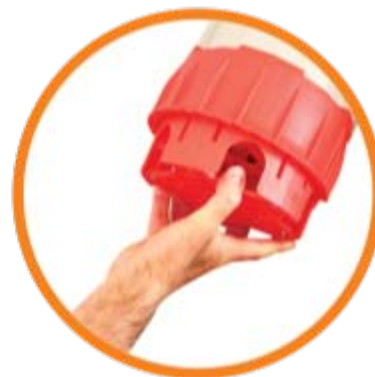
Lodo Líquido 35 mm*