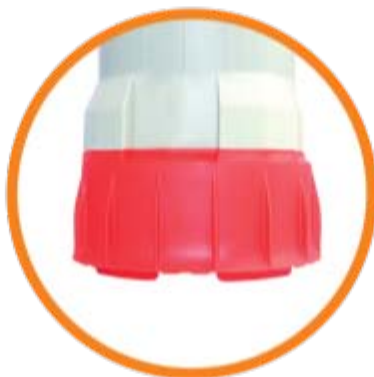
Agua Sucia 8 mm*