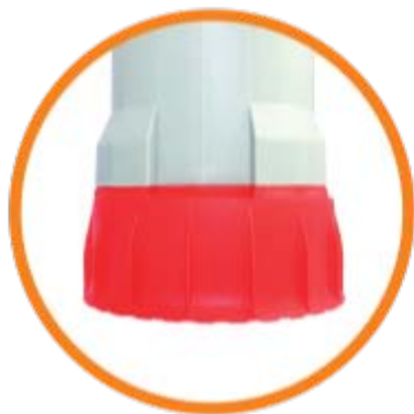
Agua Limpia 1 mm*

Es un equipo versátil, su novedoso adaptador manual giratorio le permite al usuario seleccionar entre tres modo de uso , según el tipo de líquido a bombear: